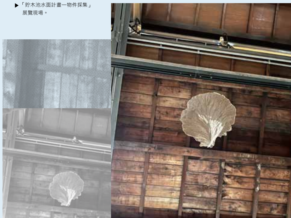
▶「貯木池水面計畫—物件採集」展覽現場。