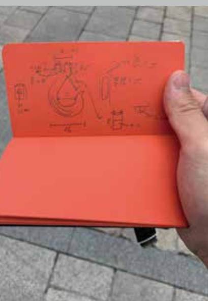
測繪路上觀察物件的手稿。