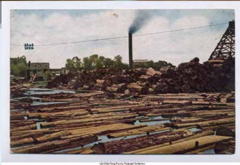
▲「貯木池水面計畫—物件採集」展覽現場。 ▼嘉義製材所設置於大正 5 年 (1916)，位於阿里山鐵路終點北門火車站前，照片所見貯木池已改建為嘉義市立文化中心。

這和過去的貯木池的歷史是斷裂的，但卻是現在實際的環境樣貌，呈現貯木池與地方居民互動的狀態。