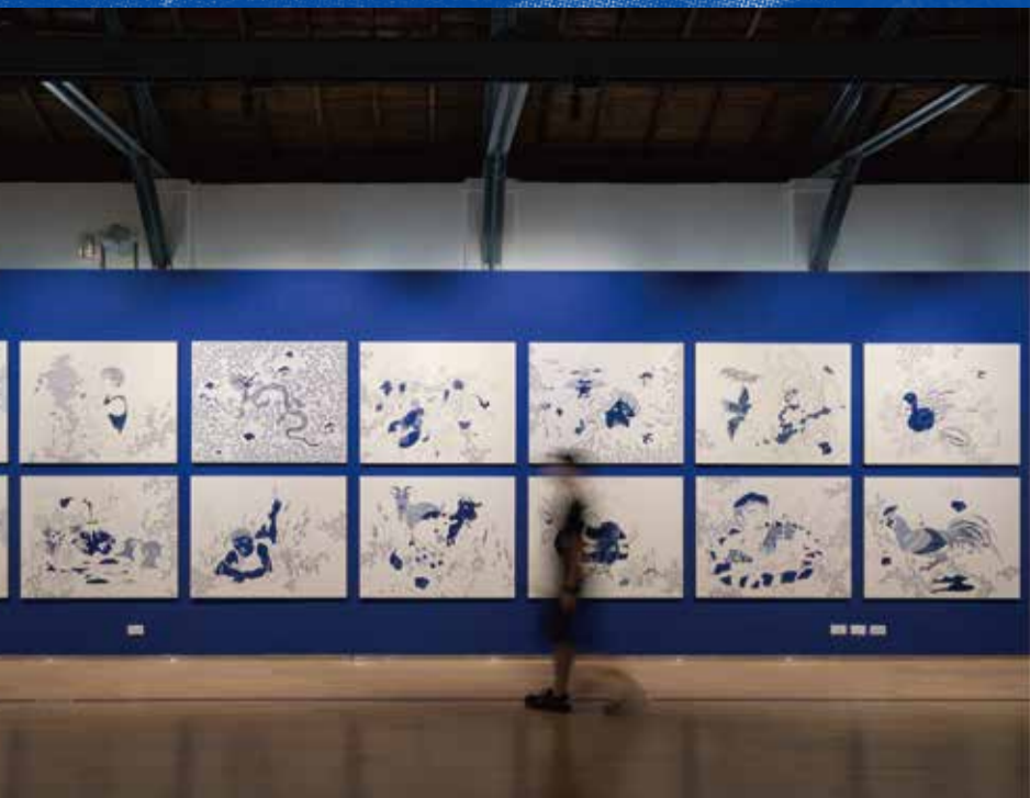
▲ 「這不是藍色的世界」展覽現場。