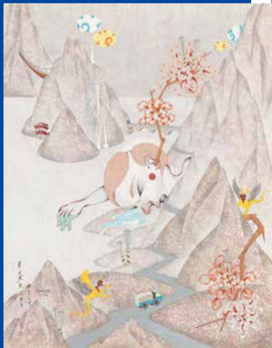
▲ 華建強，《骨肉分離系列-山洞口》 116.5cm x 91cm，墨、膠彩、畫布，2014

疫情帶給人們的感受，直接地會聯想到是藍色的。「藍色是憂鬱」的印象其實是來自於西方。在東方的文化中，藍色相對是正向的、莊嚴而自由的感受。為了此系列創作，華建強對藍色進行感官歷史的研究。以前古地圖中的河流以綠色呈現，那時，藍色是溫暖的顏色。後來人們將水的意象與藍色結合，地圖中的水從綠色轉為